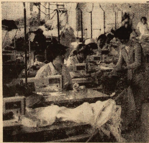
Aspect de muncă de la Întreprinderea de confecții Vulcan, una din unitățile economice fruntașe ale municipiului nostru.