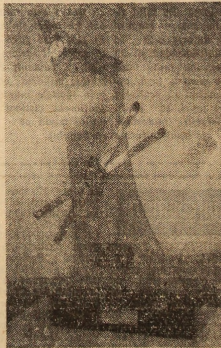
Trofeele (un exemplar în imaginea de mai sus) așteaptă cîștigătorii.