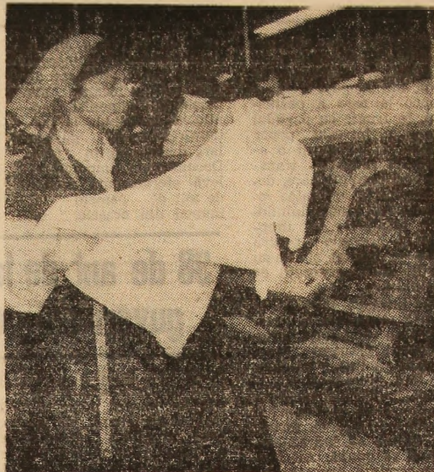
În imagine, aspect de la întreprinderea de tricotaje Petrosani.