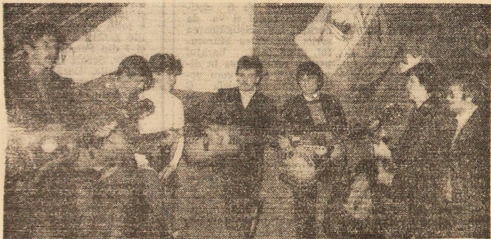
Grupul de muzică folk al studenților de la Institutul de mine, una din formațiile artistice care se pregătește asiduă pentru apropiata fază zonală a Festivalului Artei și Creației Studențești de la Timișoara.

Pe teritoriul țării noastre creația muzicală cultă din perioada barocului este reprezentată de compozitorii transilvăneni: V. Băcfark, Ion Căianu, Gabriel Reilich, Daniel Croner. Creația lor cuprinde diferite genuri vocale și instrumentale: fugi, fantezii, concerte instrumentale și vocale cantate, madrigale. Un moment important în muzica noastră din secolul al XVII-lea l-a constituit notarea și difuzarea pe calea tiparului a folclorului românesc. Valorificarea folclorului pe calea scrisului a marcat o victorie a conștiinței naționale. Ion Căianu, personalitatea cea mai reprezentativă a vechii culturi muzicale românești, a notat primele melodii în stil popular în „Codex Cajani”. Daniel Speer — trompetistul curților moldovene și transilvănene, a publicat primele piese de muzică populară.