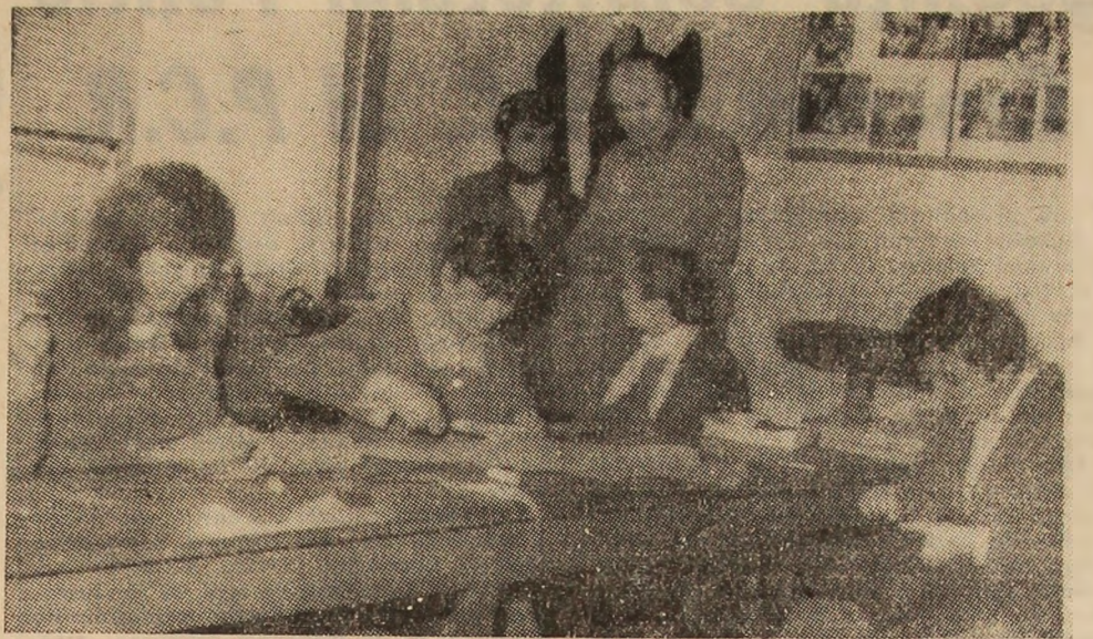
Aspect de muncă din cadrul atelierului-scoală al cooperativei „Straja” din Lupeni. Aici se pregătesc viitoarele cadre ale unităților de croitorie.