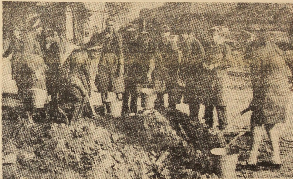
Elevele anului I A de la Școala profesională comercială din Petroșani, în o acțiune de muncă patriotică, lucrînd la amenajarea zonei de lângă magazinul universal „Jiul” din Petroșani.