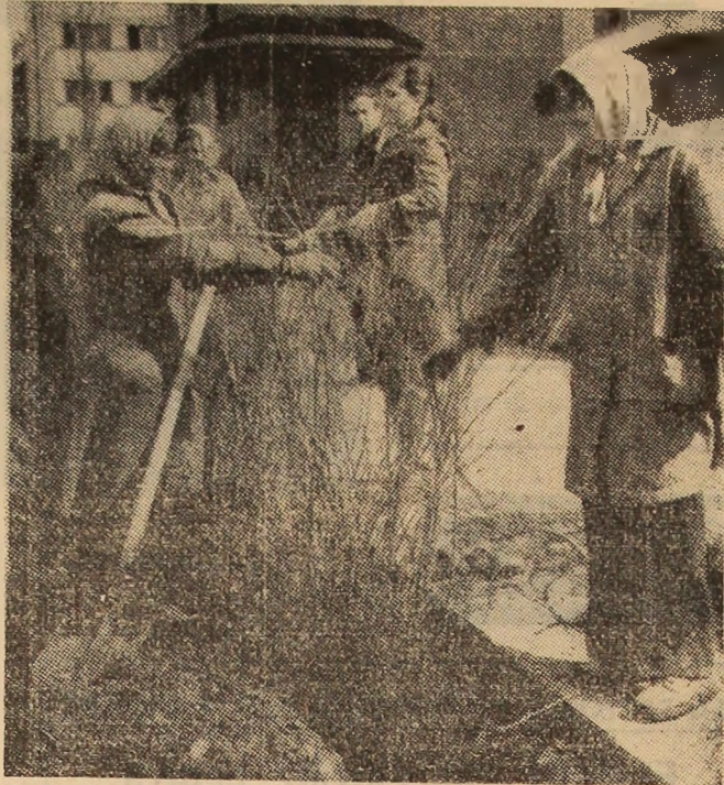
Lucrătoare de la E.G.C.L. Petroșani amenajează zona din jurul complexului comercial „Jiul”.