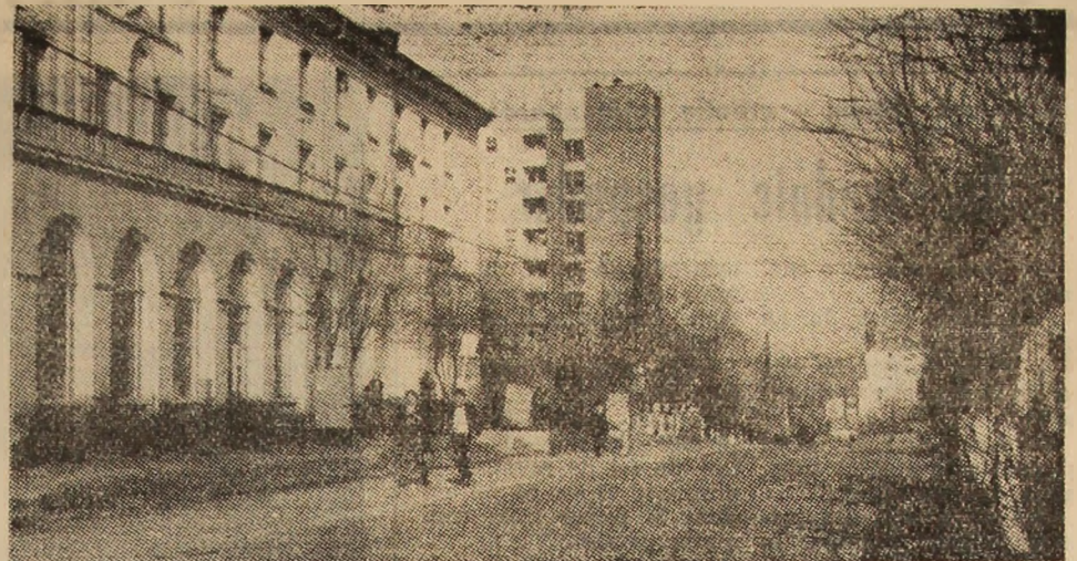
O zi de primăvară în Uricani.

ANUL XXXIX, NR. 9502 | MIERCURI, 30 MARTIE 1983 | 4 PAG. — 50 BANI