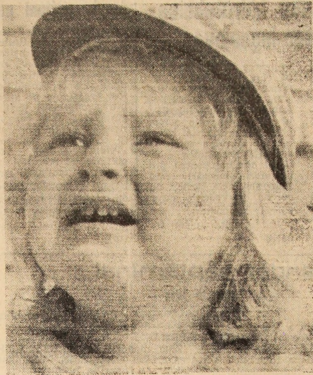
Ia-mă și pe mine!