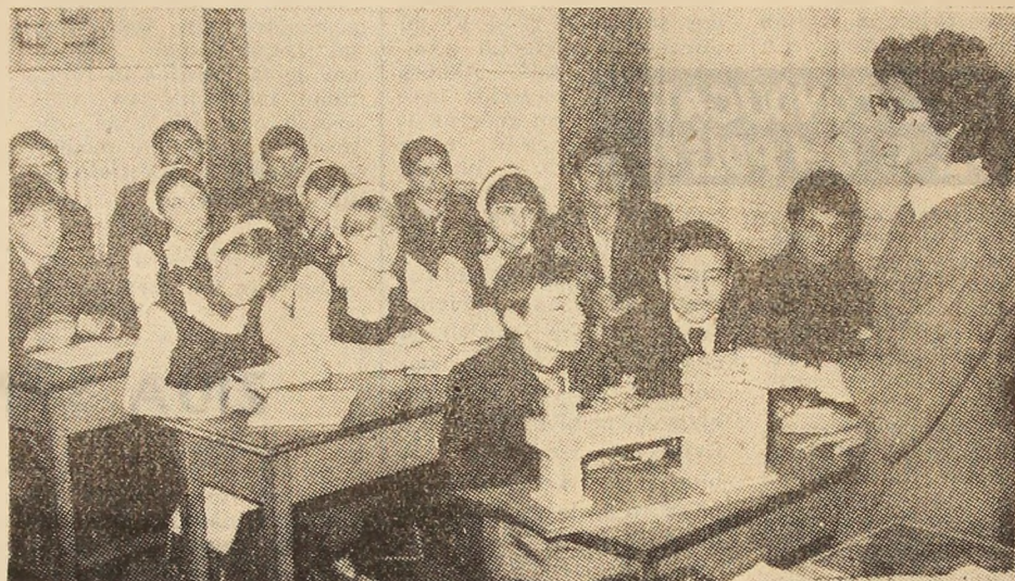
Oră într-unul din laboratoarele de specialitate de la Liceul industrial minier din Petroșani.