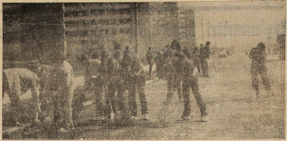
In imagine, elevii de la Liceul industrial din Vulcan lucrează la curățarea celei mai moderne artere de circulație a orașului: Bulevardul Victoriei.