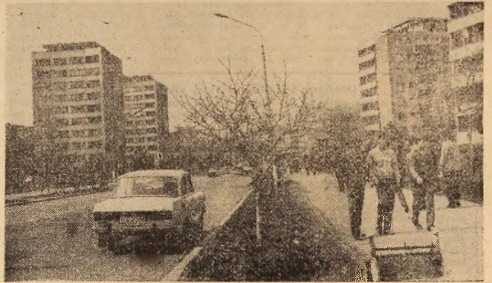
Instantaneu de primăvară pe bulevardul Vulcanului.

Odată cu finalizarea lucrărilor miniere, s-a cre- at front larg intensificării lucrărilor de montaj, lucrări executate de echipele conduse de maeștrii Iosif Materna, Nicolae Precup și Iulian Scafes. Aceste echipe au terminat deja montarea culbutorului simplu, instalația de curățat vagonete, lanțul com- pensator și banda de sub orizontul 400, în prezent fiind în curs de montare și finalizare culbutorul du- blu și cele două lanțuri compensatoare. (I.D.)