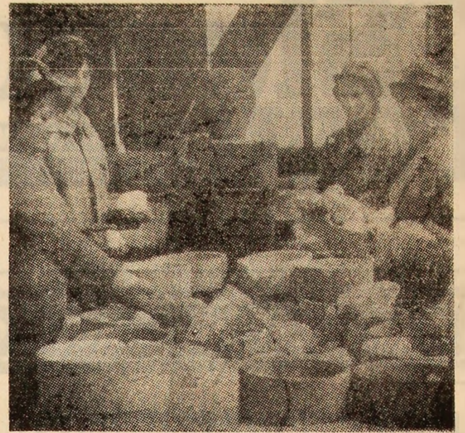
Aspect de muncă din sectorul de sortare a cuarțului calcinat de la Preparația de cuarț Uricani.