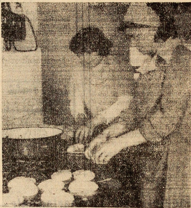
Aspect de muncă de la Cantina-restaurant din zona noului centru civic al Lupeniului.

Colectivul minci Uricani a dovedit în nenumărate rânduri că are calitățile necesare pentru a acționa cu rodnicie. Un control subteran mai sigur, căutarea și găsirea unor modalități de separare a fluxului de evaporare din subteran, împărțirea unor responsabilități precise cadrelor tehnico-ingenieresti de la sectoare și conducerea minci — iată principalele măsuri care trebuie luate neîntîrziat.