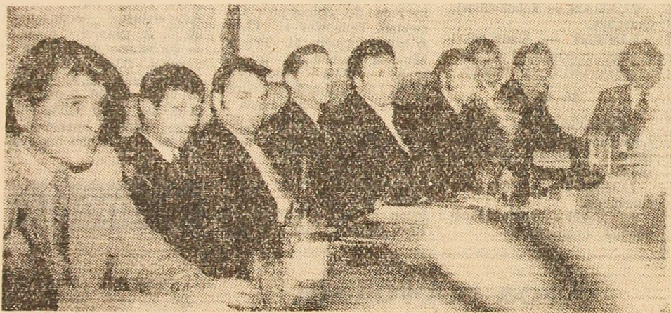
Aspect din desfășurarea lucrărilor simpozionului.