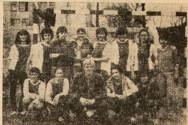
Echipa de handbal fete a Liceului de matematică-fizică din Petroșani înmănunchează autentice talente ale acestui frumos sport. Așa se explică faptul că s-au întors de la Deva cu titlul de campioană județeană la categoria 14—19 ani și cu „Cupa U.T.C.”. Imortalizarea pe peliculă a acestui eveniment a fost făcută de Tiberius Minulescu, membru al cercului foto al liceului.