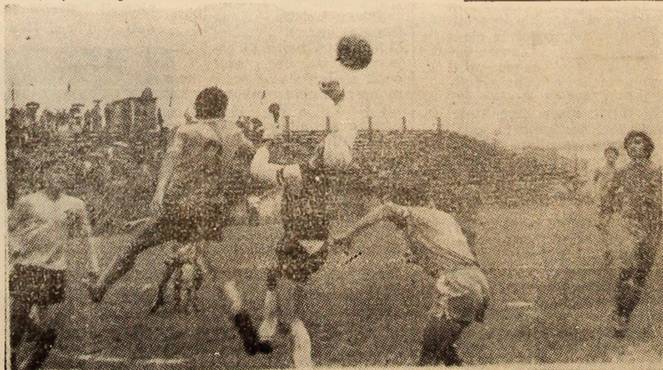
Fază din meciul Minerul-Știința Vulcan — Minerul Ghelari.