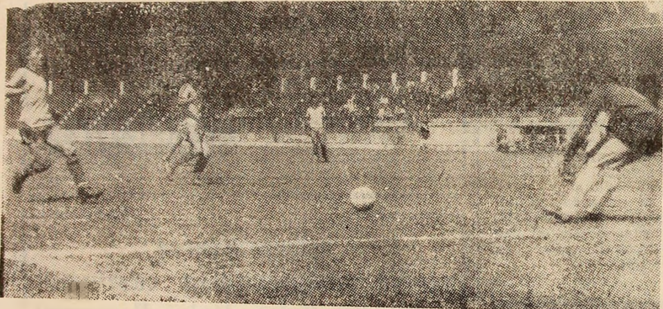
Fază din meciul Minerul Lupeni — Metalul Aiud. Șut puternic de la distanță și... gol.