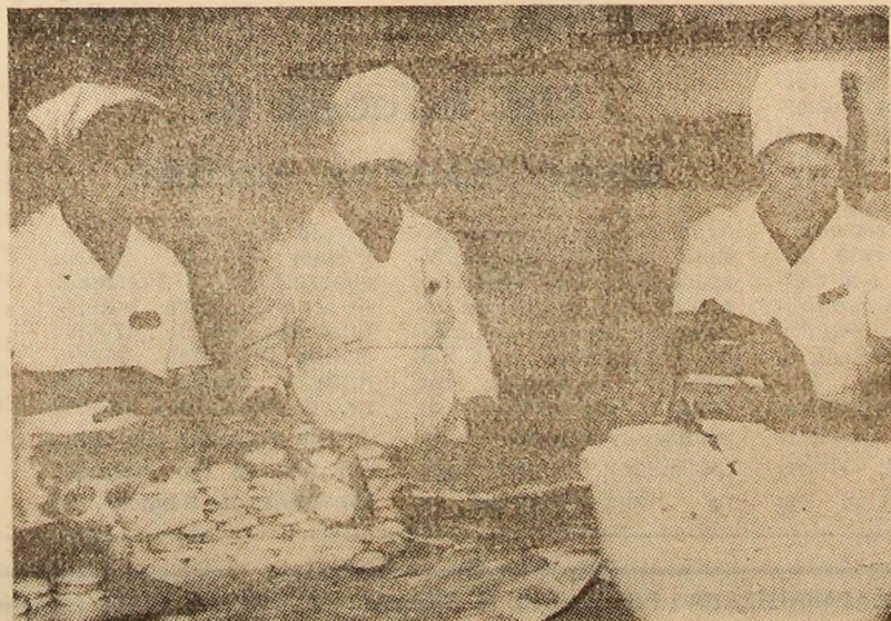
Aspect din cadrul laboratorului de preparate dulci, unitate a I.C.S. Mixtă Lupeni.

Pentru trimestrele III și IV din acest an sînt prevăzute lucrări de amenajare în piața agro-alimentară, pentru un magazin de prezentare a mobilei, deschiderea lucrărilor la un magazin universal cu peste 6200 mp și ale unui magazin general la Uricani, cu aproape 3000 mp.