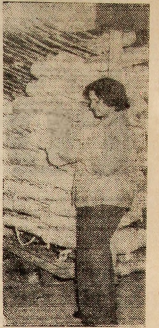
De la uscătoria de fire a secției filatură a I.F.A. Viscoza Lupeni, se scoate o nouă „sarjă”.

Odată cu oamenii din abataj, pentru a realiza din noua capacitate productivă a minei o adevărată uzină modernă de extras cărbune, pe fluxurile adiacente au fost montate un monorail pentru transportul pieselor și materialelor, instalația de interfonie pentru comunicații cu „ziua”, spre a putea urmări astfel, permanent, la pupitrul dispecerului minci, „pulsul” muncii în noul abataj. Așa se produce, azi, cărbunele cocsificabil al țării.