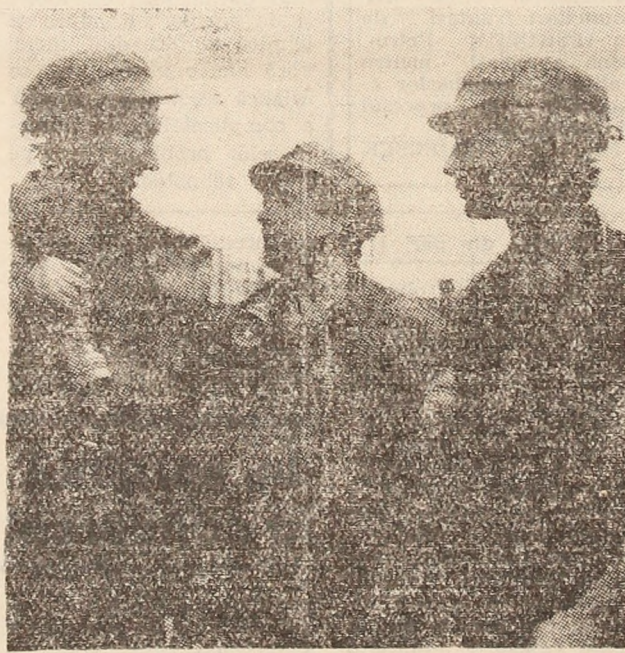
Realizarea unui cost scăzut pe tona de cărbune presupune