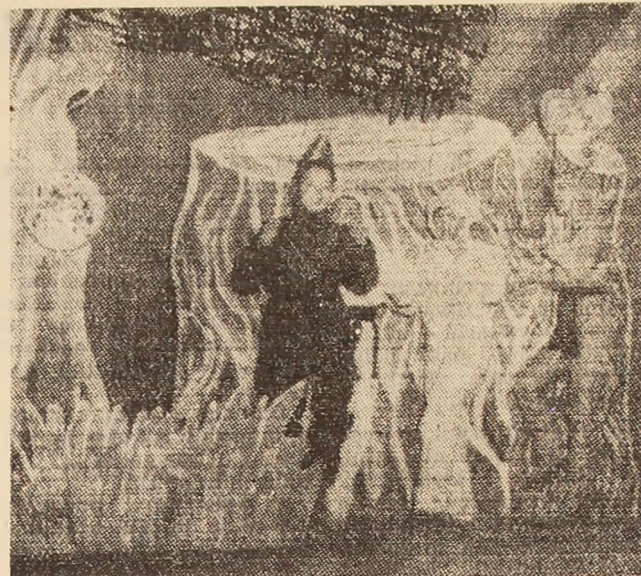
„Fotbal cu peripeții” de G. Negraru. o piesă pentru copii, mult aplaudată pe scenele din municipiu.

◆ Universitățile culturale-științifice au cuprins în anul trecut de învățământ 125 cursuri și 4700 cursanți.