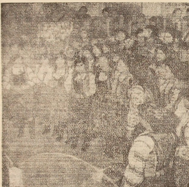
În sala de apel, „Colinda țării pentru minerii Văii Jiului” — o acțiune tradițională care crește calitativ de la o ediție la alta.