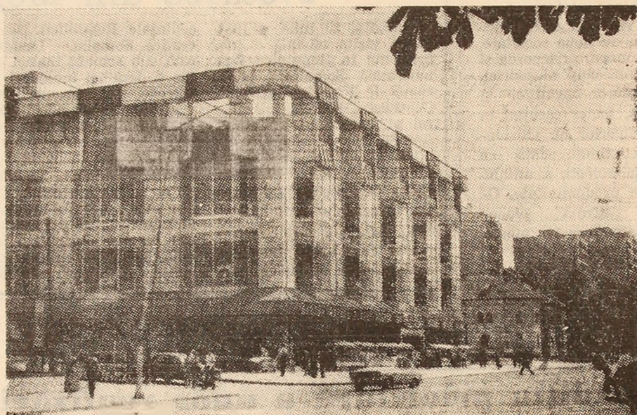
Modernul complex comercial „Jiul” din Petroșani.