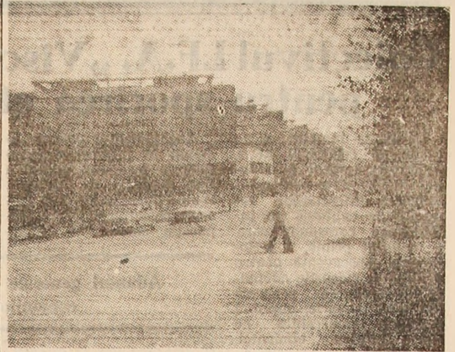
Imagine citadină de pe bulevardul Victoriei din orasul Vulcan.