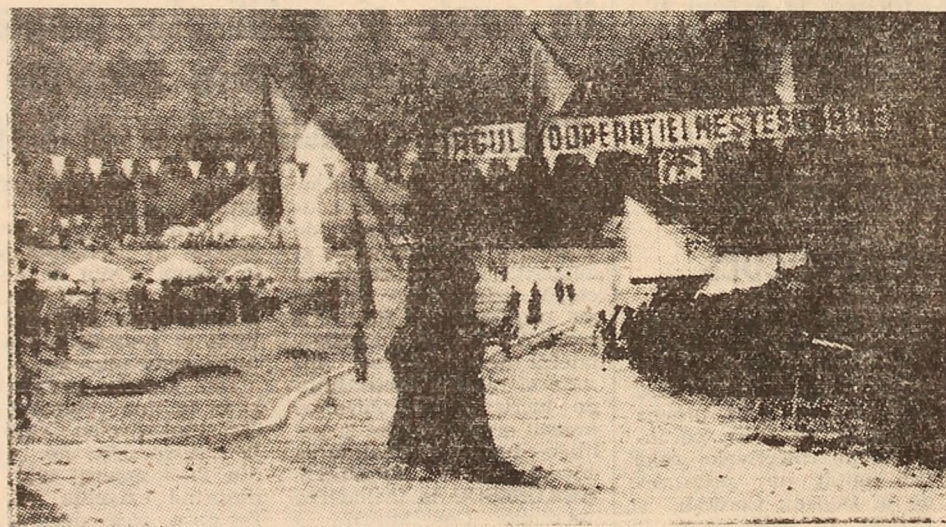
Animație la standurile Tirgului.