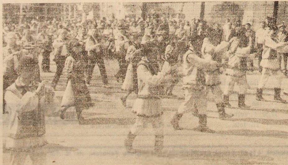
Artiștii amatori, prezintă un moment folcloric.

Entuziasmul sportivi- lor, demonstrațiile de virtuozitate și vigoare exprimă hotărîrea lor de a-și desăvîrși pregătirea sportivă, de a cuceri noi trese de prestigiu pentru sportul de masă și de performanță al Văii.