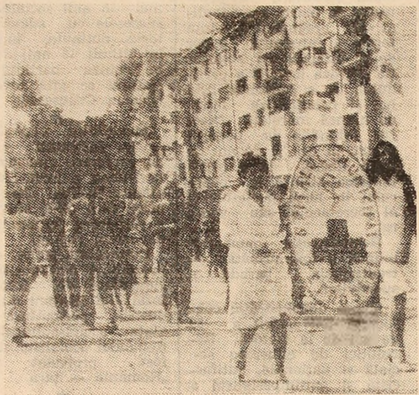
Cadrele medicale de la Spitalul municipal Petroșani, demonstrează prin fața tribunei oficiale.