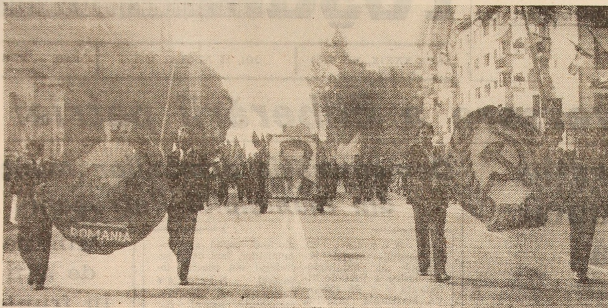
În fruntea coloanei oamenilor muncii din orasul Petrița sînt purtate însemnele patriei și partidului ce încadrează portretul președintelui Republicii, tovarășul Nicolae Ceaușescu, ctitorul României socialiste de astăzi.