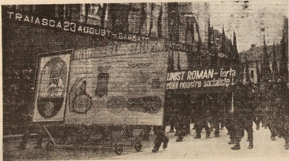
Coloana minerilor de la Lupeni.