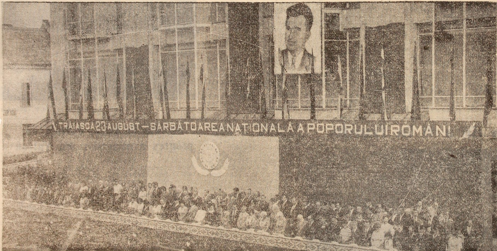
Tribuna oficială, la ora începerii demonstrației oamenilor muncii din municipiul Petroșani.

Aspecte de la demonstrația oamenilor muncii din municipiul Petroșani