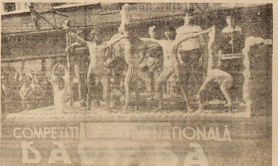
Coloana sportivilor prezintă un exercițiu demonstrativ.