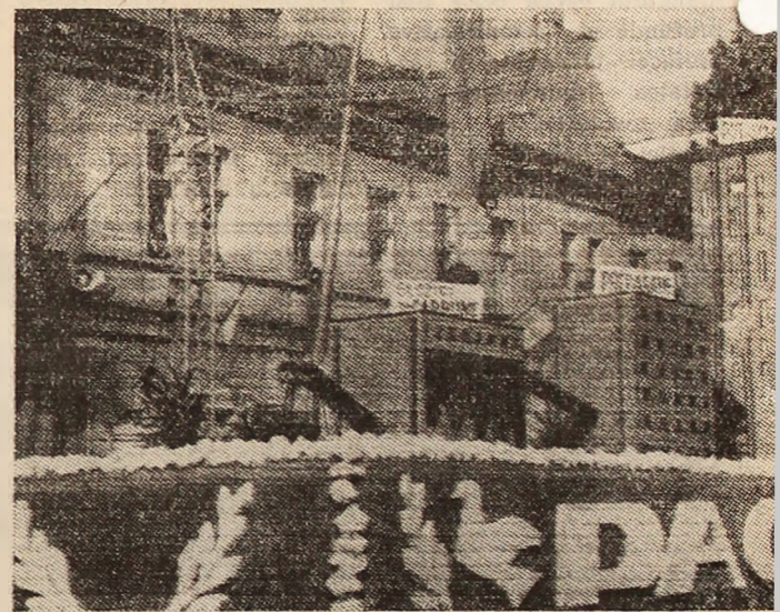
Carul alegoric al I.C.M.M. Petroșani.