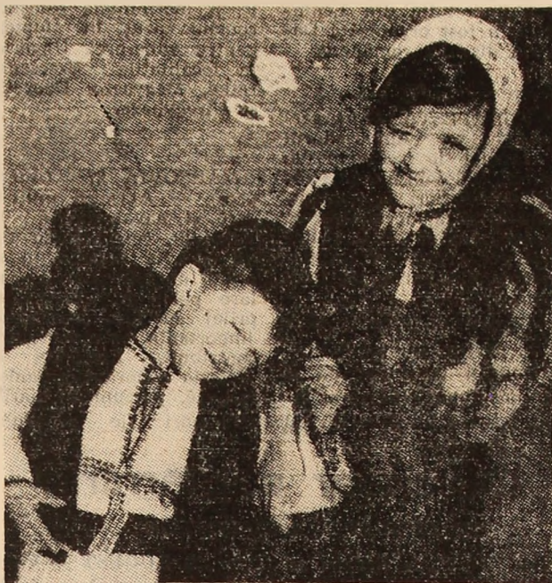
„Uite așa mi stă clopul bine...”