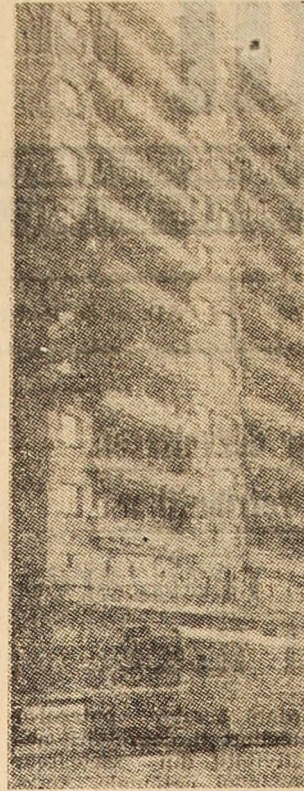
Moderne verticale arhitectonice în centrul municipiului Petroșani.