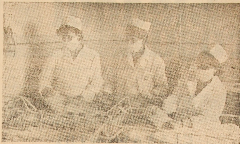
Instantaneu din salonul nou născuților de la maternitatea din Vulcan.

Momente de înaltă responsabilitate și angajare a produs în rindul tuturor celor prezenți la adunare citirea și adoptarea Mesajului către președintele celei de a 38-a sesiuni a Adunării Generale a O.N.U., a scrisorilor către ambasadele Uniunii Sovietice și S.U.A., acreditate la București. Într-o vibrantă atmosferă s-a adoptat textul unei telegramme adresate tovarășului Nicolae Ceaușescu, în încheierea căreia se spune: „Vom lupta pentru aplicarea politicii sanitare a partidului și statului nostru, pentru ocrotirea sănătății minerilor din Valea Jiului, detașament muncitoresc chemat să dea țării cât mai mult cărbune, cu convingerea că în acest mod și noi, medicii, întreg personalul medical ne aducem contribuția la realizarea independenței energetice a țării, la apărarea păcii”.