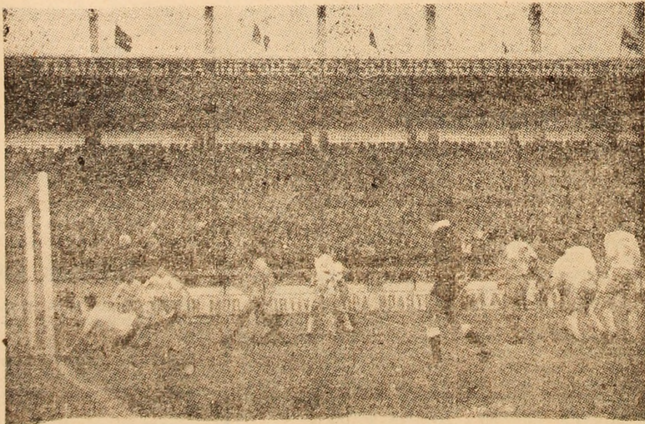
Faza din meciul „Jiul” Petroșani — Universitatea Craiova.