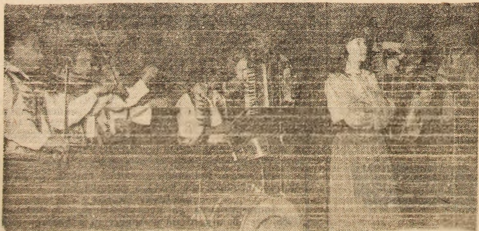
Taraful Uzinei de preparare Lupeni, o prezență vie în mijlocul colegilor de muncă preparatori, dar și pe scena Festivalului muncii și creației „Cintarea României”.