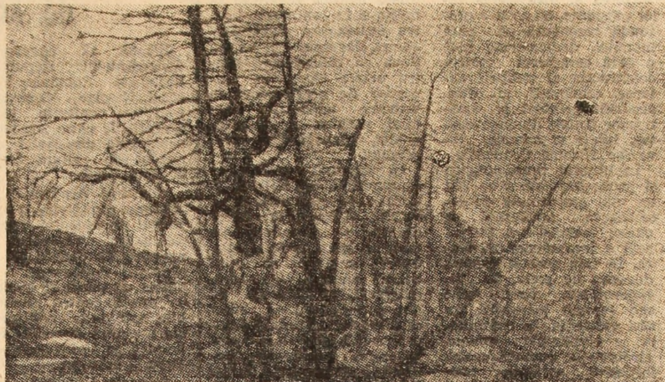
In așteptarea... zăpezii.