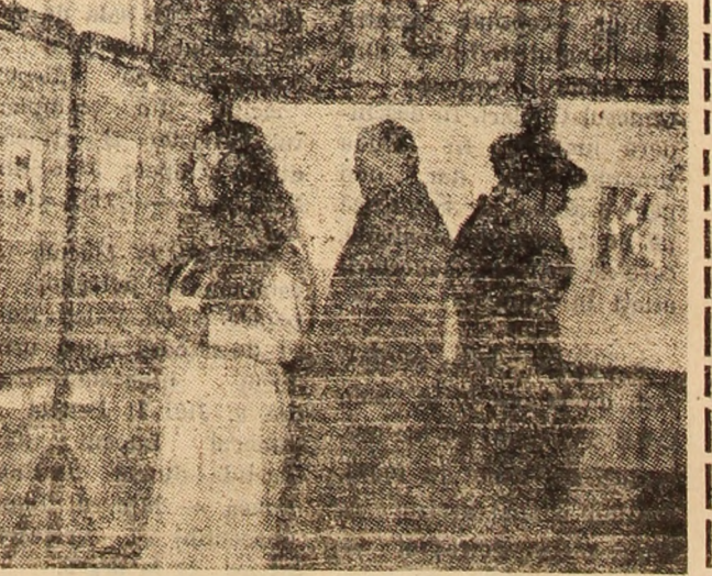
Instantaneu de la salonul de toamnă al umorului „Virsta a treia”.