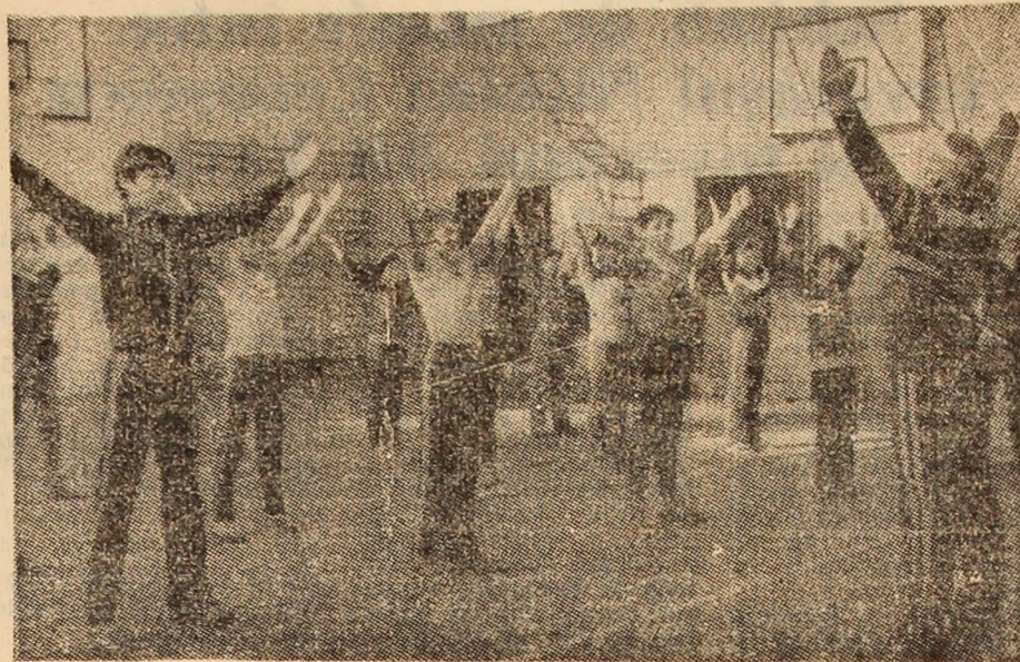
Oră de educație fizică în sala de sport.