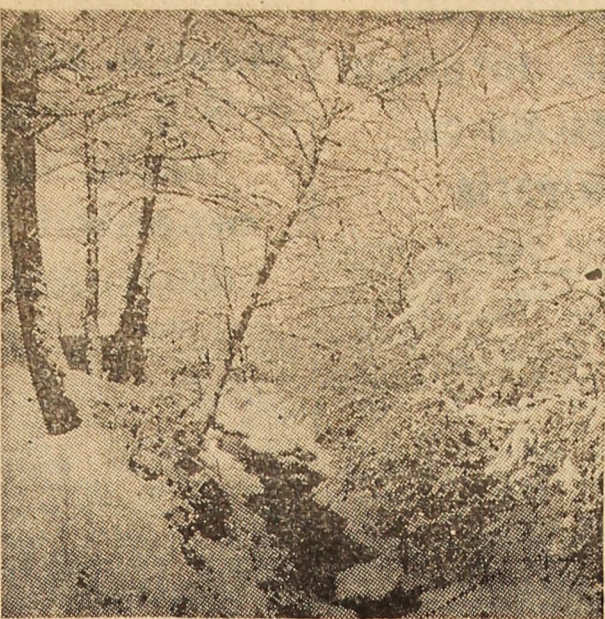
Rastel de iarnă.