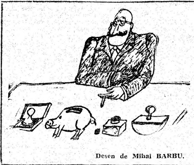
Desen de Mihai BARBU.