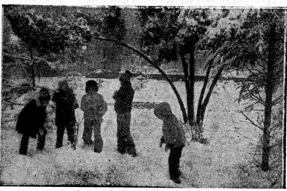
„BĂTĂLIA” POATE INCEPE!