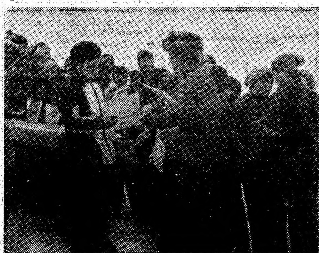
Cîștigătorilor concursului de sanie desfășurat la Aninoasa le sînt înmîinate diplome, cupe și numeroase alte premii.

Adresăm mulțumiri tuturor celor care au contribuit la buna desfășurare a întrecerilor pe pîrtie, precum și comitetului sindicatului I.M. Aninoasa pentru stimulentele acordate concurenților cîștigători. (T.T.)