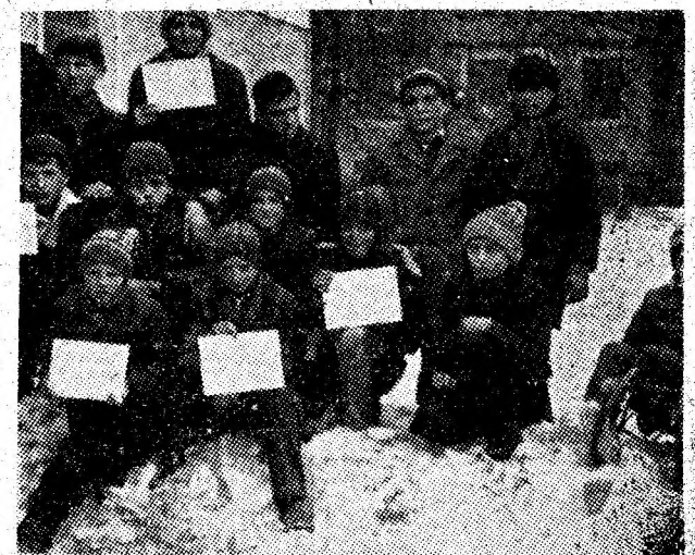
La concursul de sanie din Uricani, numeroase diplome i-au răsplătit pe cîștigătorii probei.