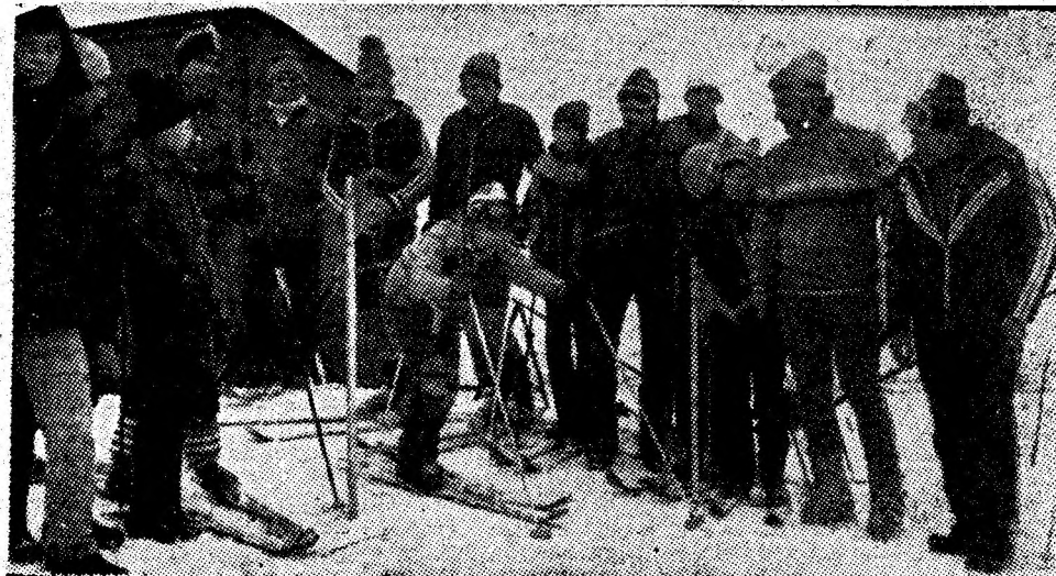
La linia de start a concursului de schi de pe dealul Chicera din Lonea.