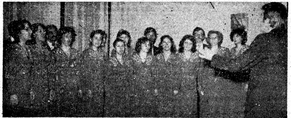
Grupul coral cameral „Armonia” al Casei de cultură din Petroșani, dirijat de prof. Adrian Schweitzer.