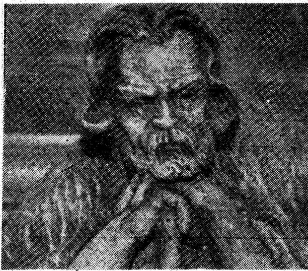
„Înțelepciune” — sculptură de artistul plastic Ladislau Schmidt din Petrila.

te puterii, disprețuiesc adevărul, confuzia valorilor dezechilibrează chiar și pe oamenii de bună credință. În acest univers frămîntat, idila Sănduca-Teofil relevă un poet profund, cascada de imagini e temperată totuși cu umor. Destinul lui Teofil Opreșan, dar mai ales devenirea sa au darul de a demonstra necesitatea legăturii funciare a prezentu-