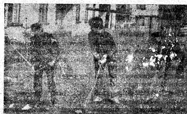
Cetățeni din blocul 1 M și 8 termic din Vulcan, la lucru.

În ultimele zile s-au plantat tuia, plopi, mesteceni în zonele spitalului municipal, complexului comercial Parîngul, la blocurile din capătul cartierului Aeroport. Activitatea de plantare va continua în ritm susținut. (T.T.)