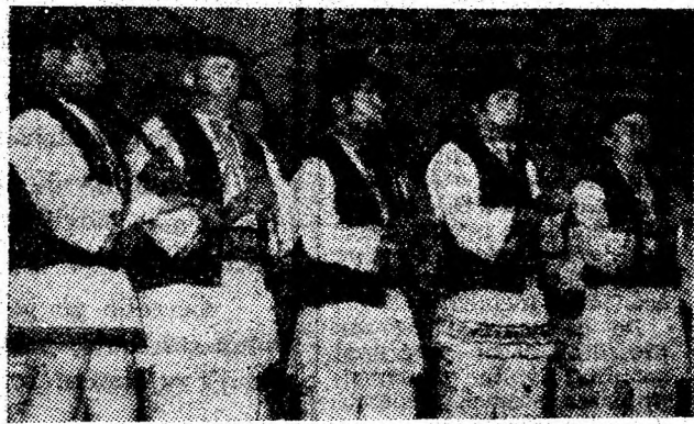
Fluierașii de la Jieț, prezență remarcabilă în cadrul Festivalului național „Cîntarea României”.