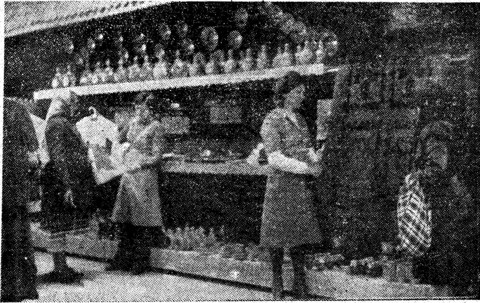
Instantaneu din cadrul raionului artizanat al complexului comercial „Jiul” din Petroșani.