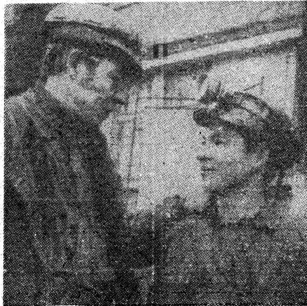
„Dialog al virstelor”.