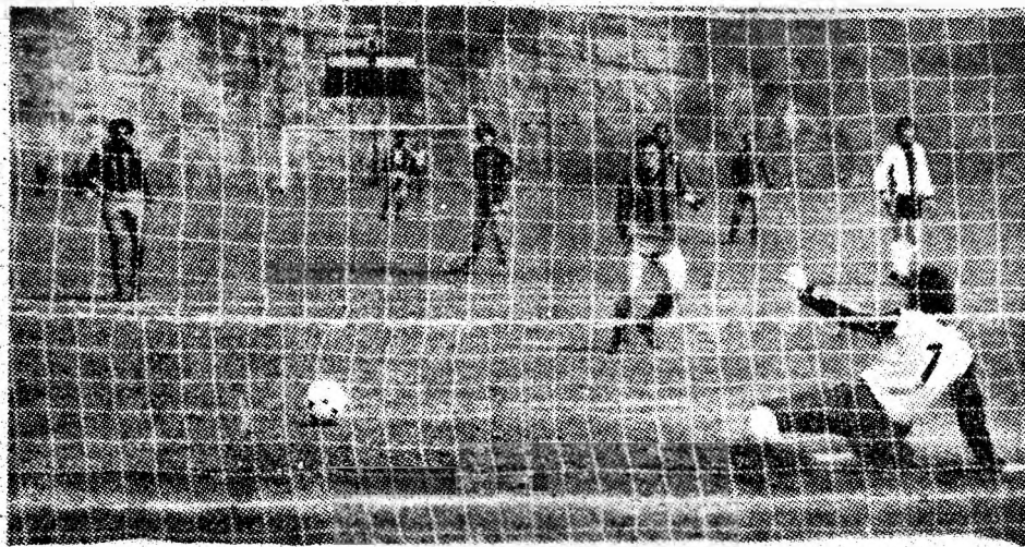
11 m. Execuție tehnică cu mult rafinament a lui Boloș, un gol frumos, la firul ierbii, și 1-0.