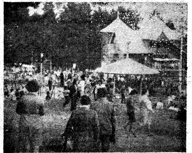
În ciuda timpului capricios, sute de cetățeni din orașul Vulcan au petrecut clipe reconfortante la baza de agrement „la Brazi”.

La cabana „Brădet” a fost o zi bună; — s-au desfășurat celor veniți să sărbătorească ziua de 1 Mai, mărfuri în valoare de peste 50 000 lei. Voia bună — ca întotdeauna — a constituit nota dominantă a petrecerii.