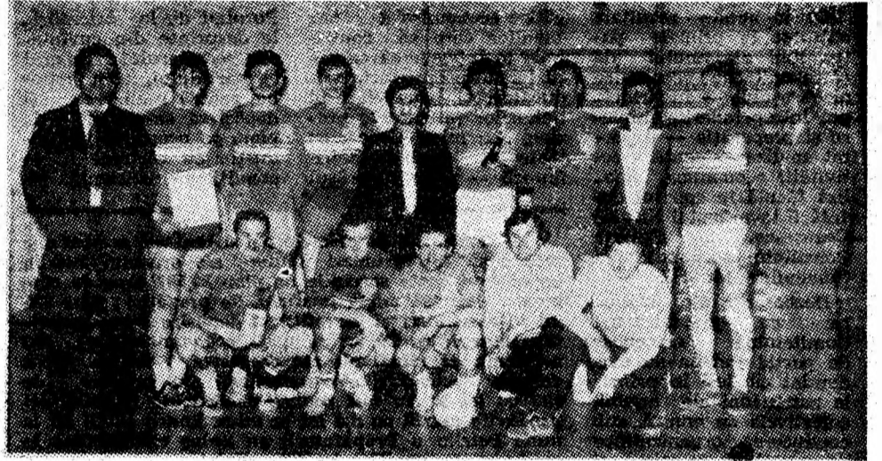
Echipa „Preparatorul” Coroești, câștigătoare a turneului interjudețean de volei.