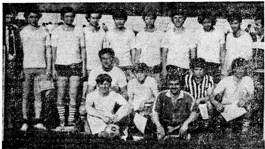
Echipa de fotbal a sectorului II de la I.M. Livezeni, cîștigătoare a „Cupei tineretului”.