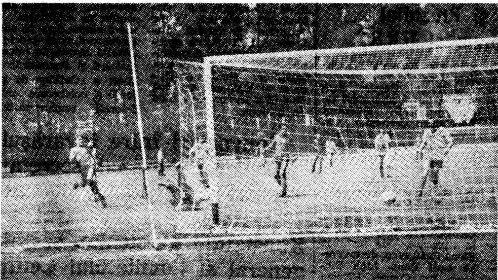
Fază din partida de fotbal de la Lupeni.