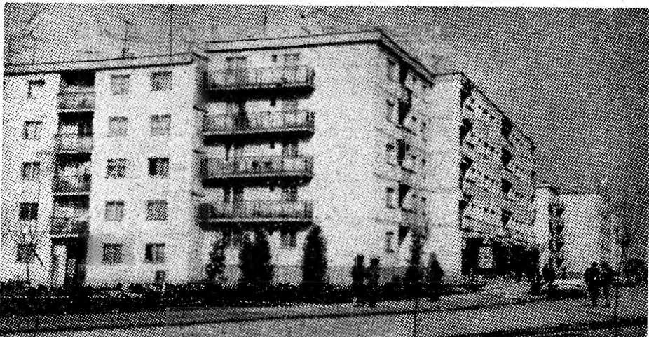
Pitorească imagine citadină din noul și modernul cartier „Bucura”.