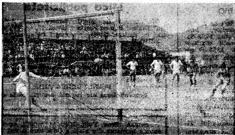
Întîlnirea de fotbal dintre echipele „Minerul” Paroșeni și „Metalul” Bocșa, s-a soldat cu o victorie la limită a gazdelor: 1-0. Este un rezultat care confirmă, încă o dată seriozitatea cu care s-a pregătit și a evoluat echipa gazdă, pe tot parcursul campionatului.