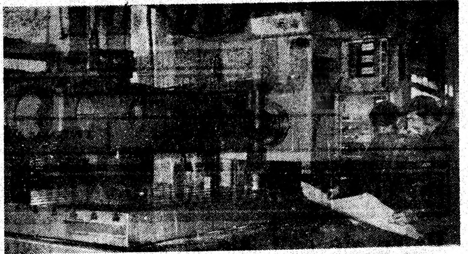
Aspect de muncă din secția mecanică grea din cadrul I.U.M. Petroșani.