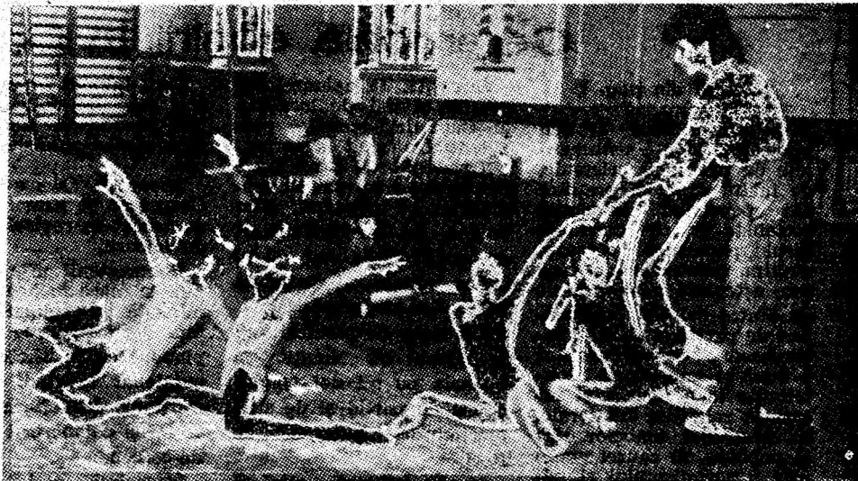
„La lucru” în sala de gimnastică a Școlii sportive din Petroșani unde se pregătesc micuțele gimnaste, care peste cîțiva ani vor reprezenta Valea Jiului în numeroase concursuri naționale și internaționale.