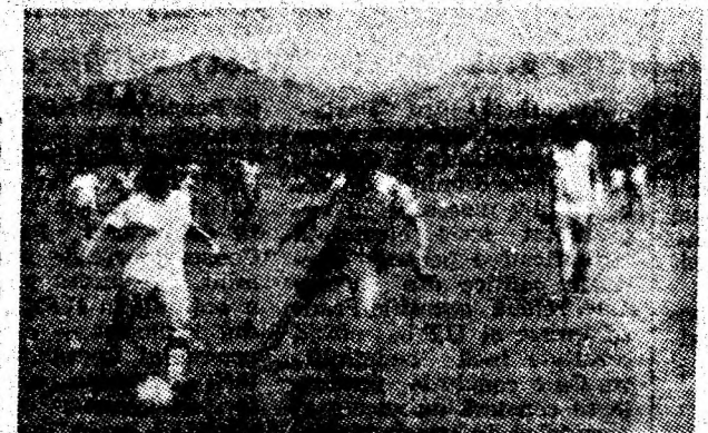
Fază din meciul disputat între fostele glorie ale Jiului și echipa feminină „Carmen”. Ilustrația : Șt. NEMECSEK

tural și profesional, au pus în valoare creativitatea și vastul potențial spiritual al colectivelor miniere, de la preparării, din alte întreprinderi și instituții, al mișcării artistice de amatori din Vale. De asemenea, competițiile sportive, petrecerea plăcută a timpului liber, în cadrul serbărilor cîmpenești ale „Nedeii vulcănene” cât și a celorlalte acțiuni din diferite orașe ale Văii, demonstrează convingător pluralitatea