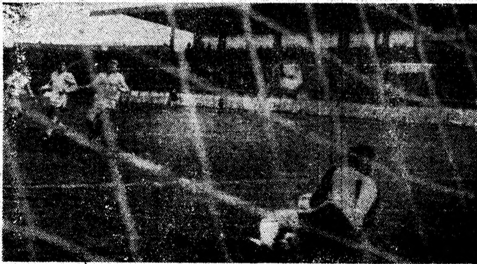
Vă amintiți? Este unul din cele mai bune meciuri ale „Jiului” pe teren propriu.