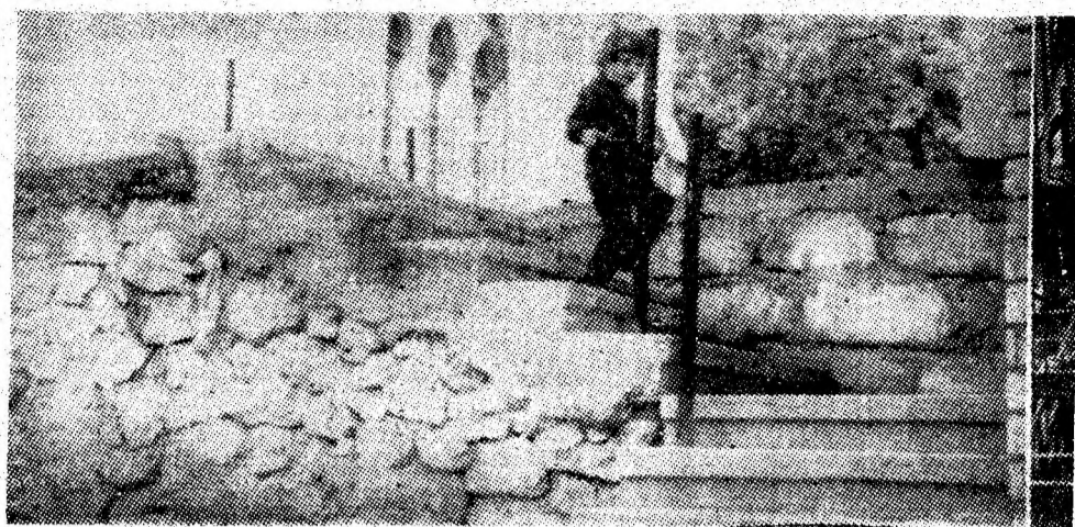
Scari fără balustrade și balustrade fără scări sau lucrări neterminate și „uitate” de constructori la blocurile IA și IB din Petrosani, date în folosință de mai bine de un an, în plin centrul orașului.