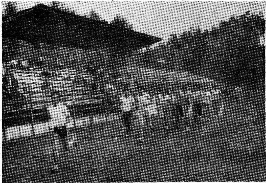
Instantaneu de la probele de rezistență fizică susținute de candidații la admitere la Institutul de mine Petroșani.