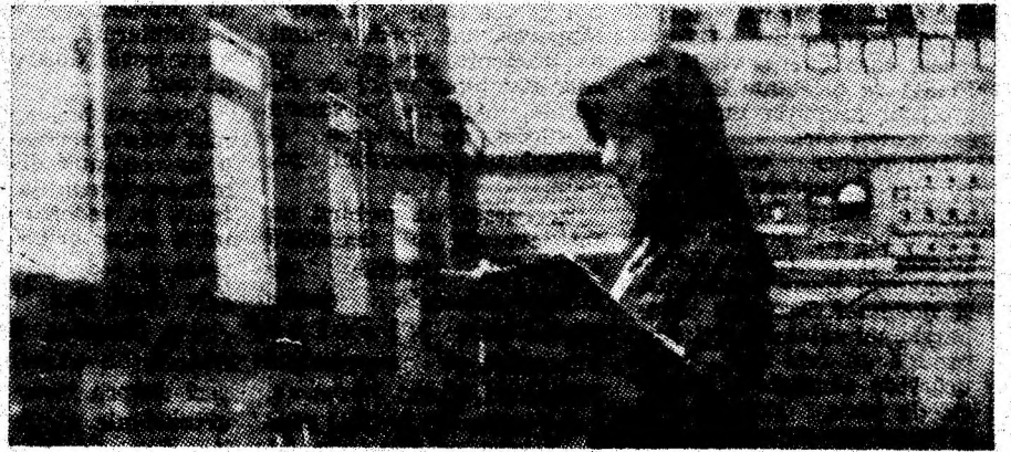
Aspect de la stația telegizumetrică a minei Lupeni.

Mineritul Văii Jiului a străbătut în anii socialismului, mai cu seamă după Congresul al IX-lea al partidului, cea mai spectaculoasă perioadă de dezvoltare din întreaga lui existență seculară. Prin grija partidului și statului nostru, a tovarășului NICOLAE CEAUȘESCU, minele din bazinul Văii Jiului au cunoscut în această fertilă perioadă, o puternică dezvoltare a capacităților de extracție; s-au deschis cimpuri miniere noi, accentul principal punându-se pe mecanizarea lucrărilor miniere de bază din subteran, pe introducerea de tehnologii avansate de înaltă productivitate, care să ofere minerilor atât condiții optime de muncă cât și de securitate deplină. Acest semnificativ aspect — al deplinei securității a muncii minerilor —, ilustrând pregnant grija față de om acordată în societatea noastră socialistă — constituie tema paginii de față.