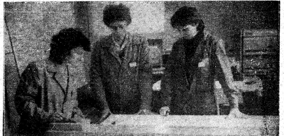
Instantaneu din sala echipamentelor de prelucrare și trasare a informațiilor grafice, la centrul de calcul electronic Petroșani.

stat, ale tovarășului Nicolae Ceaușescu, pe linia ridicării rolului factorilor calitativi în dezvoltarea economico-socială a țării noastre, o reprezintă noul mecanism economico-financiar adoptat de Plenara C.C. al P.C.R. din martie 1978. Avînd drept principale elemente definitorii autoconducerea muncitorească și autogestiunea economico-financiară, participarea oamenilor muncii la beneficii ca formă suverană de stimulare materială, introducerea indicatorilor de plan producție fizică și producție netă în locul indicatorului producție globală, perfecționarea sistemului de prețuri și creșterea rolului pîrghiilor valorice și financiare — noul mecanism economico-financiar asigură cadrul pentru organizarea și conducerea științifică, la nivel micro și macro-economic, a economiei, mobilizarea și utilizarea eficientă a resurselor, îmbinînd în mod fericit stimularea materială cu răspunderea materială personală. Aplicarea lui fermă, cu simț de răspundere, conduce la folosirea cu maximă eficiență a forțelor de producție, în scopul sporirii venitului național — baza creșterii neconținute a bunăstării materiale și spirituale a întregului popor.